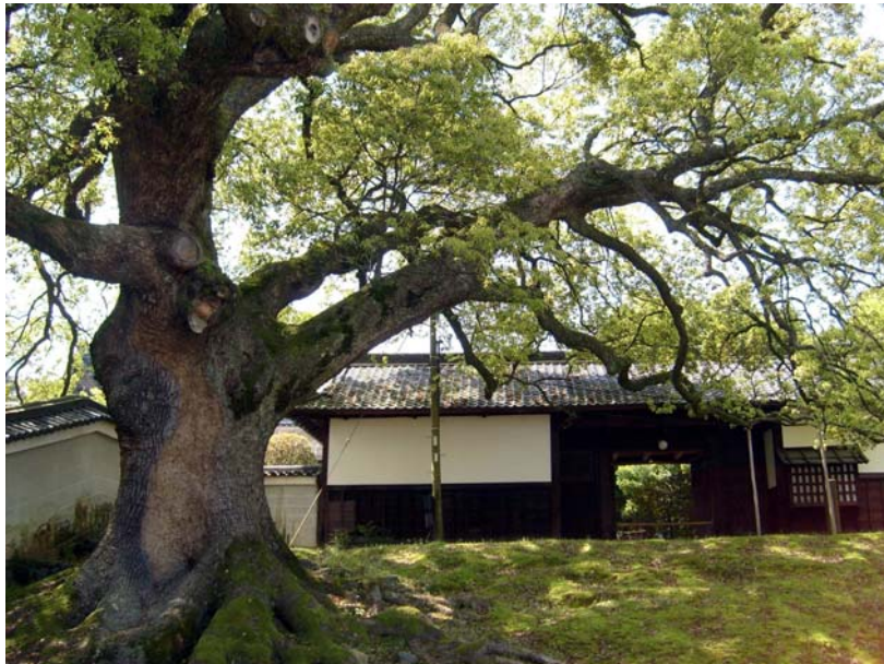
Вход в монастырь Сёрэн-ин.

Отношение к этому месту у нас особое – непохожее на обычное уважительное восхищение остальными киотскими святилищами и красотами. Сёрэн-ин, настоятель которого традиционно является главой и нашей организации, тем самым оказывается связан с каждым из нас уже гораздо более личными отношениями. Эта близость, до сих пор ощущаемая где-то очень глубоко, в то утро была подтверждена на почти официальном уровне. Когда мы пришли в храм, вход на территорию которого стоит 500 йен, с нас, как с членов Организации, не взяли даже этой мизерной суммы.