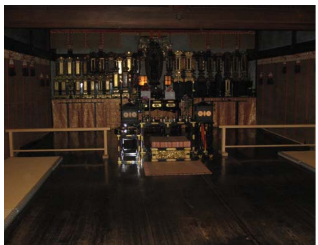
Синдзёко-до - главный павильон храма, в котором хранится знаменитая мандала и снтай Фудо-Мёо.

Одним из ответвлений школы Тэндай стала чрезвычайно популярная в средние века, да и в сегодняшней Японии, школа Чистой земли будды Амида – Дзёдо. Дзиэн покровительствовал новому учению и предоставил убежище его основателю – Хонэну и его ученику – Синрану. С тех пор каждый глава штаб-квартиры секты Дзёдо – храма Хонгадзи, чтобы быть признанным в этом качестве, обязан пройти своеобразную стажировку в Сёрэн-ин. Вообще, верность традициям и есть – главная и лучшая традиция Сёрэн-ин. Так, например, семнадцатый по счету настоятель храма и один из сыновей императора Фусими в средние века стал создателем уникального стиля каллиграфии, соединившего в себе лучшие китайские и японские традиции. Этот стиль