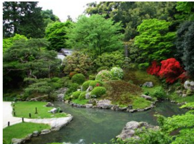
Памятник Дзиэну во дворе храма и Рюдзин-но икэ - Пруд сердца дракона