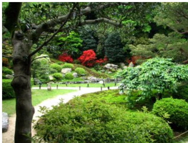
Внутренний дворик и сад Кирусима работы мастера Кобори Энсю.