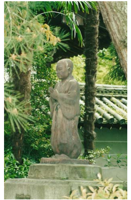
Каменная чаша Итимондзи Тёдзюбаси - дар великого полководца Тоётоми Хидэёси. Монастырский колокол.. Памятник Дзизну во дворе храма.

Чуть позже – в 2005 году было восстановлено изрядно поблекшее от времени главное сокровище Сёрэн-ин – мандала (буддийское схематичное изображение Вселенной) – дар военного объединителя Японии Тоётоми Хидэёси. В Центре мандалы изображен Будда Дайнити Нёрай, но вообще Сёрэн-ин - единственный храм в Японии, посвященный популярному в период Хэйан, а ныне практически забытому, будде – Синдзёко Нёрай.